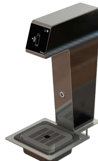
Version 1 distribution EF avec 1 capteur infrarouge (détection contenant)